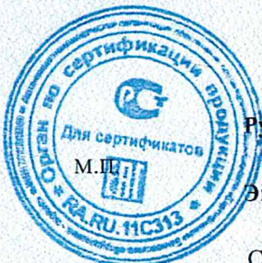
Схема сертификации 13с